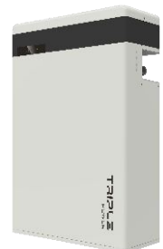
LiFePO 4 5.8kWh